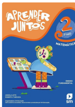
Aprender Juntos: Matemática - 2º Ano Editora: SM 7ª edição ISBN: 9786557442555