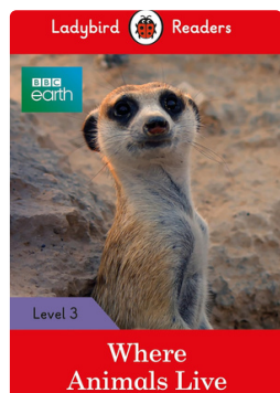
WHERE ANIMALS LIVE? Ladybird Readers ISBN: 9780241298688