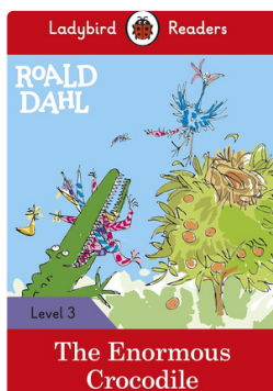
ROALD DAHL: THE ENORMOUS CROCODILE Ladybird Readers ISBN: 9780241368169