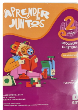
Aprender Juntos: História e Geografia - 2º Ano Editora: SM 1ª edição ISBN: 9786557443866

Acesse o portal SM Direto por meio do link: