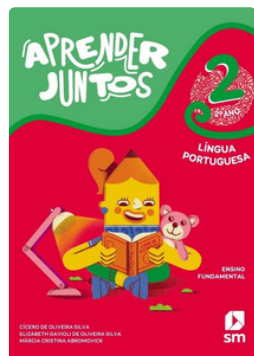
Aprender Juntos: Língua Portuguesa - 2º Ano Editora: SM 8ª edição ISBN: 9786557442500