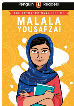
MALALA YOUSAFZAI Penguin Readers ISBN: 9780241447376