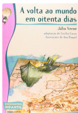
A Volta ao mundo em 80 dias Autor: Júlio Verne Editora: Scipione ISBN: 8526264532 978-8526264533