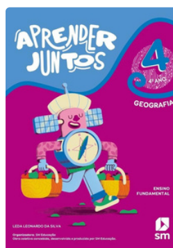
Aprender Juntos: Geografia - 4º Ano Editora: SM 7ª edição ISBN: 9786557442722

Acesse o portal SM Direto por meio do link: https://www.smdireto.com.br Voucher de compra: 8184F110