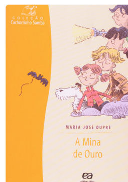
A mina de ouro Autor: Maria José Dupré Editora: Ática ISBN: 8508081790 978-8508081790