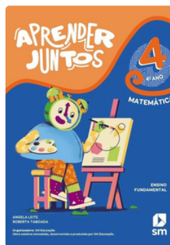
Aprender Juntos: Matemática - 4º Ano Editora: SM 7ª edição ISBN: 9786557442579