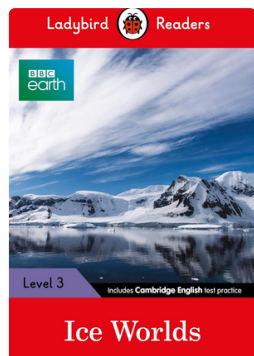
ICE WORLDS Ladybird Readers ISBN: 9780241319574