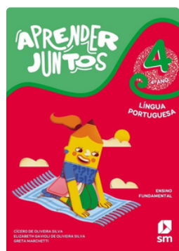
Aprender Juntos: Língua Portuguesa - 4º Ano Editora: SM 8ª edição ISBN: 9786557442524